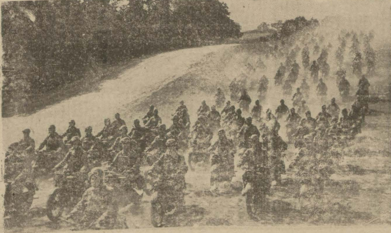
İngiliz adalarını müdafaa etmek için vücutta getirilen kuvvetlerden: Motosikletli ordu

Londra, 29 (A.A.) — Romadan alınan bir habere göre Libyada bulunan İtalyan kuvvetleri Almanların emrine verildi.